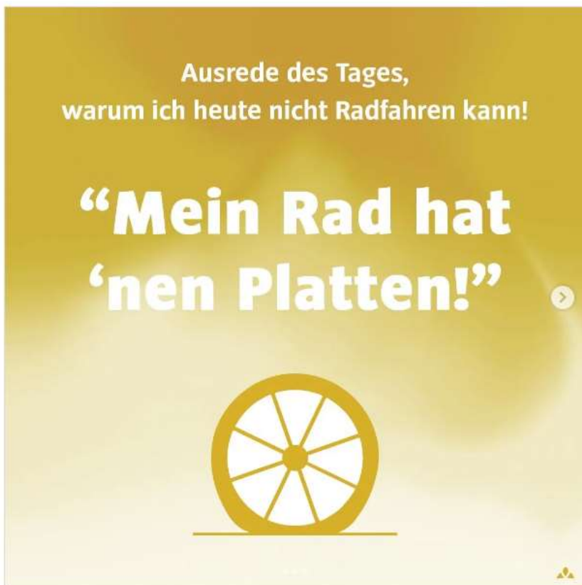
vaudesport • Folgen vaudesport 108 Wo. Wer kennt es nicht: Man ist motiviert, will losfahren und schon ein kleiner Defekt macht einen Strich durch die Rechnung. Dabei können wir die meisten Reparaturen am Rad einfach selbst machen. Es ist gar nicht so schwer. 🛠️🚲🥰 Welche Reparaturen an deinem Bike konntest du schon selbst in die Hand nehmen? Wir sind gespannt auf eure Kommentare! Diese Woche ist die Europäische Woche der Nachhaltigkeit. Wir möchten anlässlich derer motivieren aufs Rad zu steigen und sich nicht von den bekannten Ausreden abhalten zu lassen. Denn Radfahren macht Spaß und ist aktiver Klimaschutz! 🌱🌱 Gefällt 182 Mal 20. September 2022 Melde dich an, um mit „Gefällt mir“ zu markieren oder zu kommentieren.