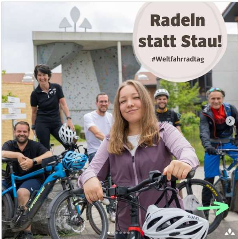
vaudesport • Folgen vaudesport #Radeln statt #Stau! Heute ist #Weltfahrradtag! 🚲 Wir sind stolz auf unsere vielen Kolleginnen und Kollegen, die nicht nur heute, sondern über das ganze Jahr hindurch mit dem Rad zur Arbeit kommen. Seit Jahresbeginn ist unsere Belegschaft schon über 20.000 km geradelt. 🥰🥰 Wir haben 6 unserer Kolleg*innen befragt, die am häufigsten und weitesten zur Arbeit radeln und wollten wissen, worin ihre Begeisterung fürs Fahrrad begründet ist. Das persönliche Wohlbefinden steht dabei immer an oberster Stelle! Zudem ist Radeln gut fürs Klima. 🌱 Aus unserer jährlichen Klimabilanz wissen wir, dass wir druck... Gefällt 401 Mal 3. Juni 2023 Melde dich an, um mit „Gefällt mir“ zu markieren oder zu kommentieren.